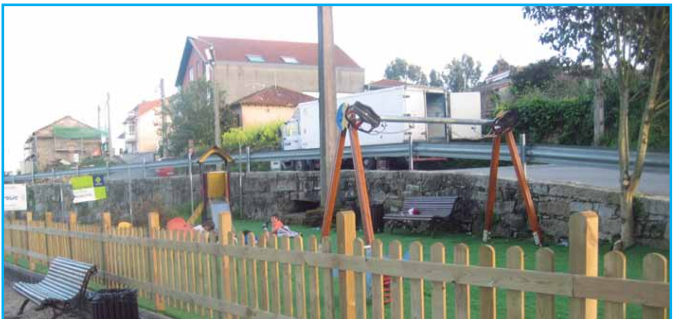
No Sineiro, a Deputación financiou o mobiliario e equipo informático do local social ademáis do novo valado e melloras no parque infantil.