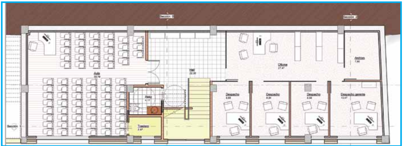
Plano do que será a segunda planta do novo local social dos empresarios groveses

O apoio da Administración provincial permitirá dotar aos empresarios groveses dun lugar de traballo axeitado para desenvolver a súa labor con maior comodidade.