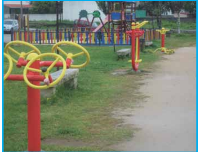
En As Besadas ademáis do parque infantil, a Deputación financiou mobiliario para o local social e un parque biosaludable para os maiores