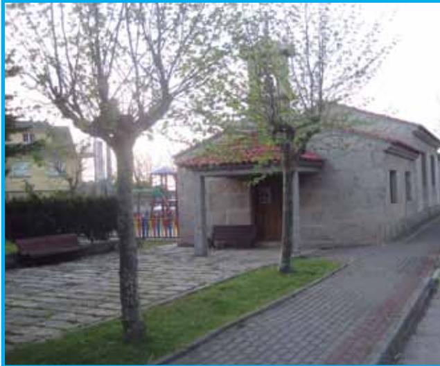
A capela das Baladas e o seu contorno melloraron notablemente. Altar, campanario, mobiliario, parque infantil, xardín, etc. deron outro aspecto o lugar

Rafael Louzán, permitiu a estas entidades levar a cabo proxectos que repercuten no benestar de todos os veciños.