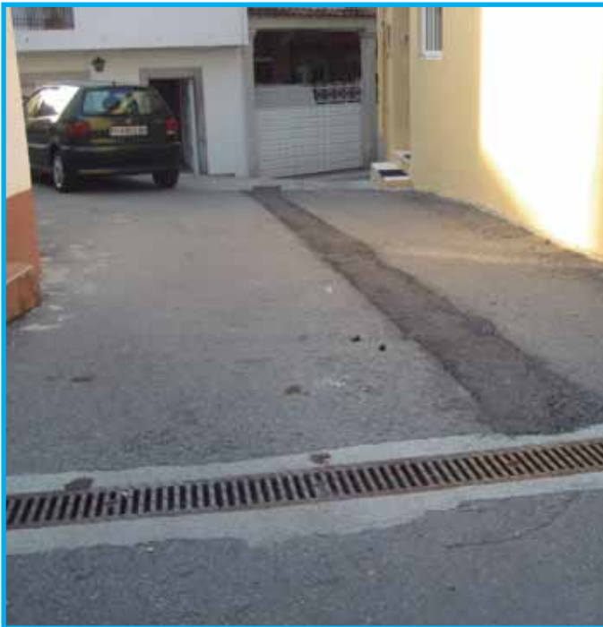
Sobre estas liñas, a recollida de augas pluviais executada na Vilavella paliou os graves problemas de inundacións que había nalgunhas casas do lugar, para tranquilidade dos veciños e veciñas desta zona

Baixo estas liñas, o lavadoiro de Reboredo, que recobrou un aspecto máis tradicional e acorde co medio rural no que se atopa. Pedra e madeira danse amán para embelecer a praza.