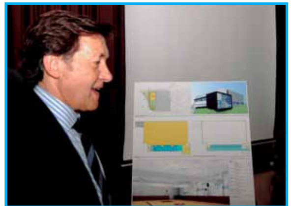
Lete presenta o proxecto do novo polideportivo

O que non fixeron PSOE-BNG en catro anos estao a facer a Xunta de Feijoo en menos tempo e con moitos menos recursos. Demóstrase así o compromiso acadado con este concello polo actual goberno galego e que outros prometeron pero non cumpriron, coa connivencia do goberno grovese.