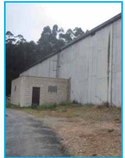
Depósito de auga de Reboredo.

Os populares lamentan que “de novo haxa que facer obras para solucionar o problema e case seguro a base de bombeos, co custe